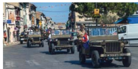
Défilé le 14 juillet, après une cérémonie en présence d'une délégation de la ville d'Abenserg