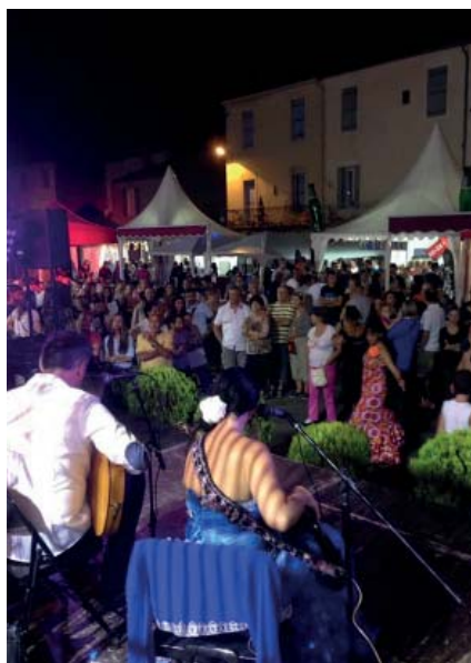
Chaudes soirées au Village de Feria