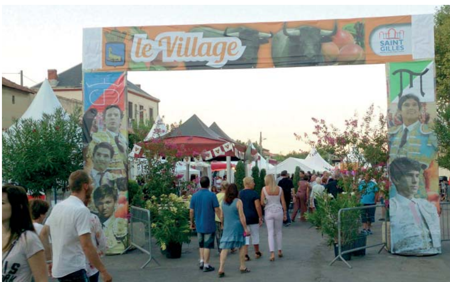
Renaissance du Village de Feria