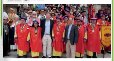
Depuis le premier de ses amis à recommander

La ville accueillait ce dimanche 14, un chapitre extraordinaire de la Compagnie des vins de Pays du Gard, une association qui regroupe ces connaisseurs et amateurs de ces vins et qui en font la promotion.