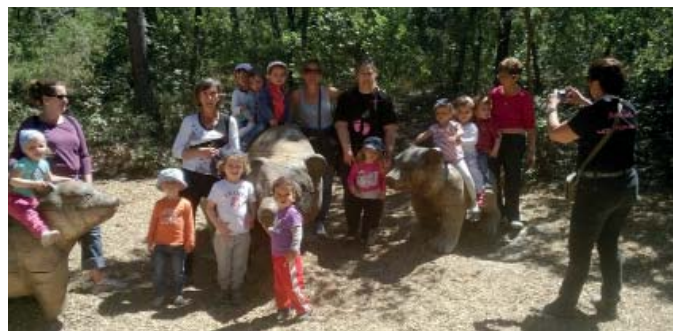
Souvenir d'une sortie au zoo organisée par « Les Premiers pas »

Elle fédère un certain nombre d'assistantes maternelles, regroupées en association pour proposer des animations contribuant à l'éveil d'une cinquantaine d'enfants (matinées de jeux, galette des rois, visite de la ferme de Saliers, découverte du cirque, spectacles de Pâques et de Noël). Leurs nombreuses initiatives à l'attention des Saint-Gillois (marché du Terroir, bourse puériculture, sortie au carnaval de Nice, etc) permettent d'autofinancer les activités proposées aux enfants. Elles disposent par ailleurs de certaines infrastructures de la commune, telles que des aires de jeux et entretiennent un lien permanent avec la Médiathèque (apprentissage du respect du livre, conteuse).