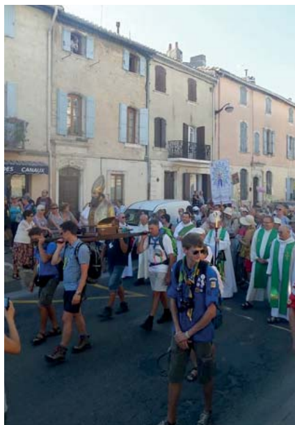
Traditionnelle arrivée des pèlerins