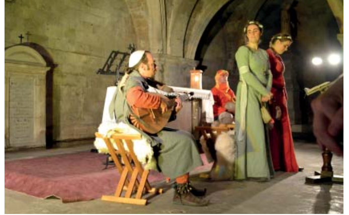
Musique médiévale et Renaissance dans la crypte de l'abbatiale