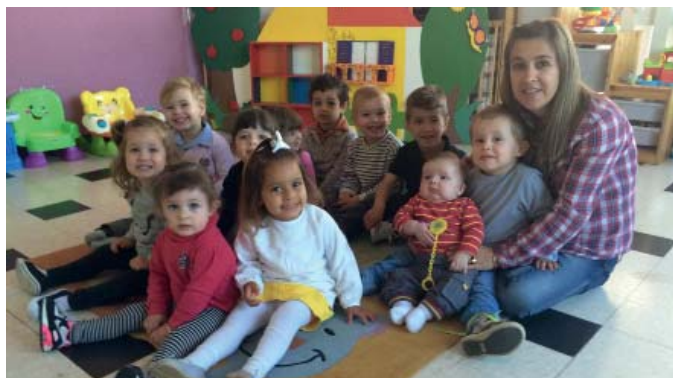
Garde collective pour les petits de « L'île aux enfants »

12 places disponibles avec une équipe de 3 professionnelles agréées pour encadrer vos enfants, à des horaires adaptés à vos besoins.