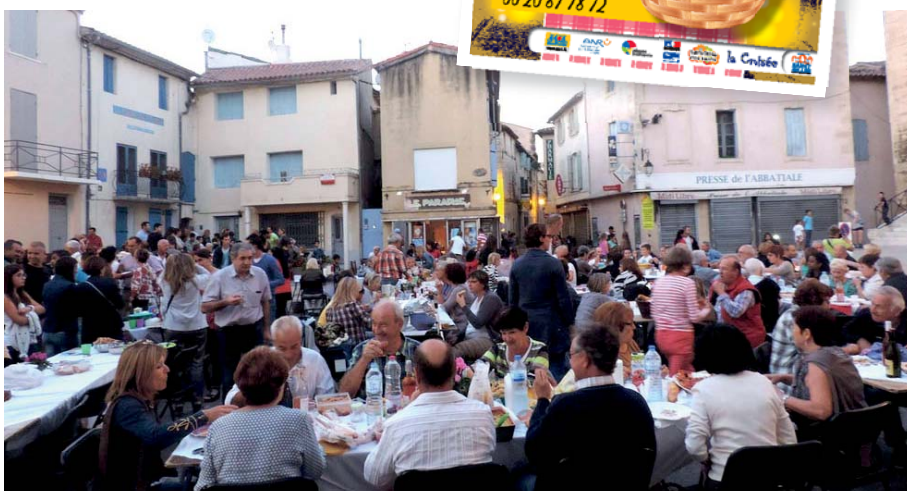
Une nouvelle dynamique pour notre cœur de ville

Le pari des organisateurs est donc largement gagné et d'autres éditions permettront de revivre et sans doute d'élargir encore ce moment de pure convivialité dans un écrin que beaucoup nous envient.