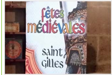
Fêtes médiévales de Saint-Gilles.

7 ans | 9 septembre 2015 à 13:00 | Actualité | 0 Comment