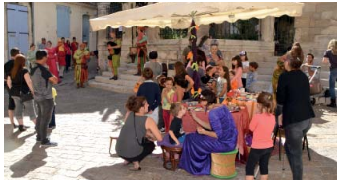
Maquillage pour les enfants sur le thème du Moyen Age