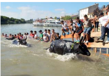
Pas une fête de la saint Gilles sans sa gaze. . .