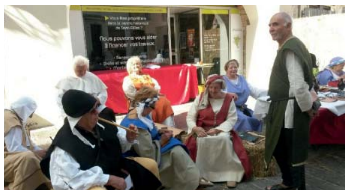
Démonstration par l'amicale des Peintres saint-gillois