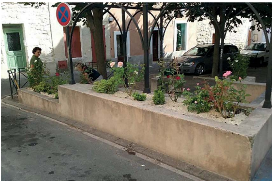
Plantation place de la Poissonnerie

Saint-Gilles, lieu de pèlerinage et porte de la Camargue, peut se parer d'emplacements floraux plus nombreux.