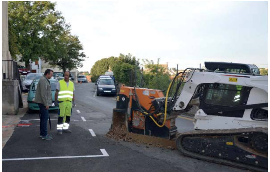
Alain VULTAGGIO, conseiller municipal délégué à la vidéo protection et aux voisins vigilants, en visite sur le chantier

Remplacer le matériel existant, étendre le dispositif et optimiser l'exploitation des images obtenues ; telles sont les mesures qui visent à mieux protéger nos concitoyens et leurs biens, par un système véritablement opérationnel 24h/24 et 7j/7.