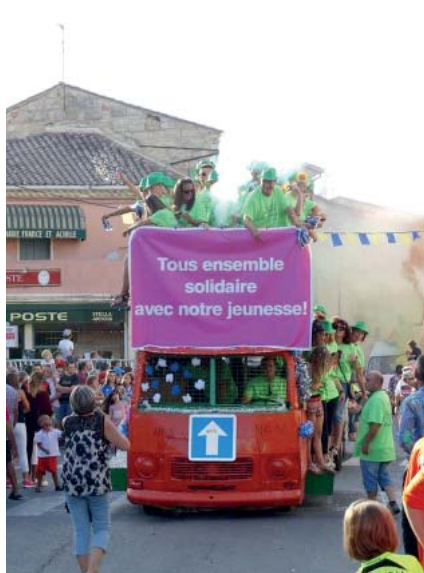
Nos commerçants aux côtés de la jeunesse saint-gilloise