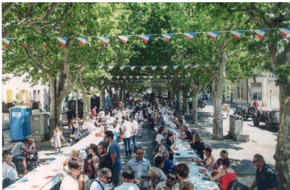
Belle affluence au 1 er banquet républicain du 14 juillet