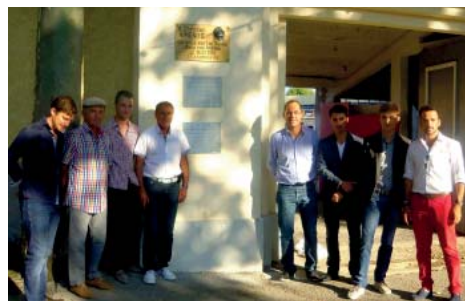
Eleveurs, torero, empresa et élus marquent l'histoire des arènes