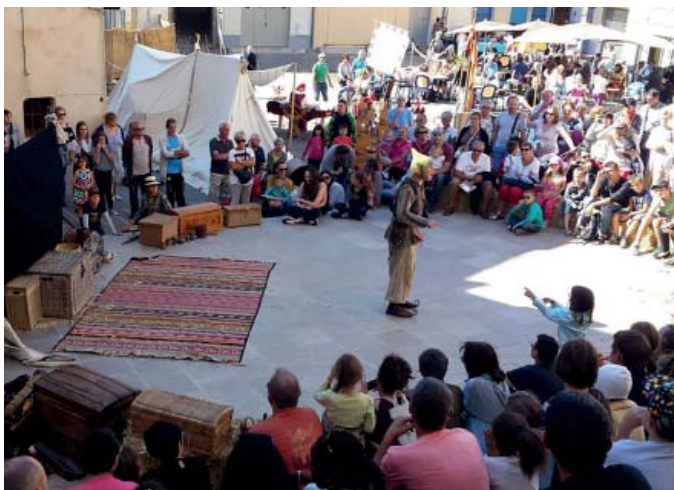
Une foule attentive a assisté aux reconstitutions historiques