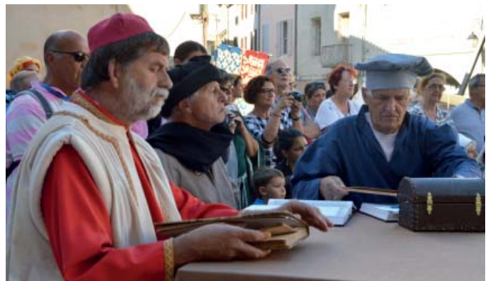
Une remarquable prestation de l'association d'Histoire et d'Archéologie