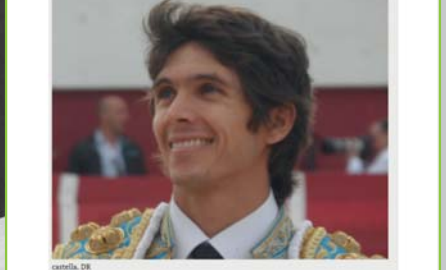
Après le succès de l'édition 2014, l'empeza Toro Pasión propose en 2015 une programmation riche, variée et comparable aux affiches des grandes fêtes !

Samedi 22 août 2015 - 17h30, Novillada, Découvertes et confirmations, 1er tournée « chaquetilla d'or » offert par les agriculteurs saint-gillois. Novillada d'ouverture de fête, non dénuée d'intérêt. Découverte, avec la présentation des novillos de la