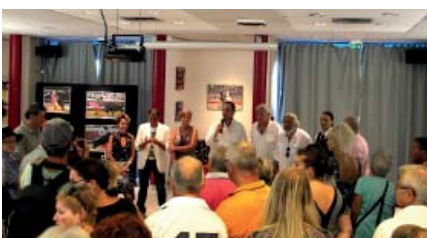
Vernissage de l'exposition de la Feria à la médiathèque