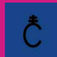
ROCÍO DE LA CÁMARA

18h : Corrida exceptionnelle (arènes Émile Bilhau)